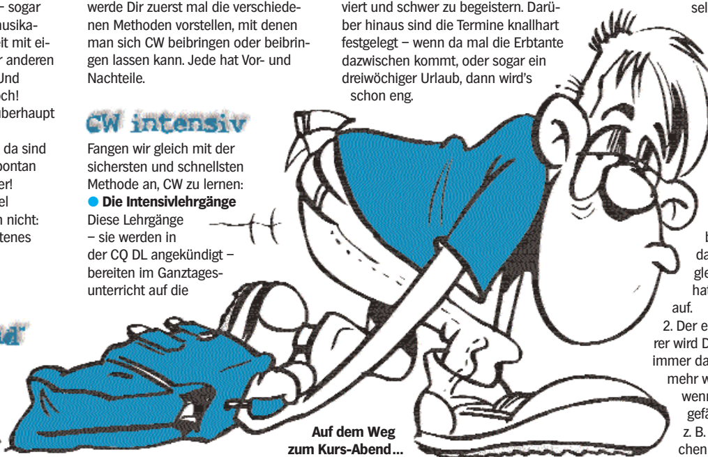
Auf dem Weg zum Kurs-Abend...

Drei Kassetten (38 DM) - sie reichen bei weitem nicht aus. Jede Kassette oder CD spielt eine gute Stunde, länger nicht. Du benötigst aber allein zum Erlernen der Morsezeichen be-