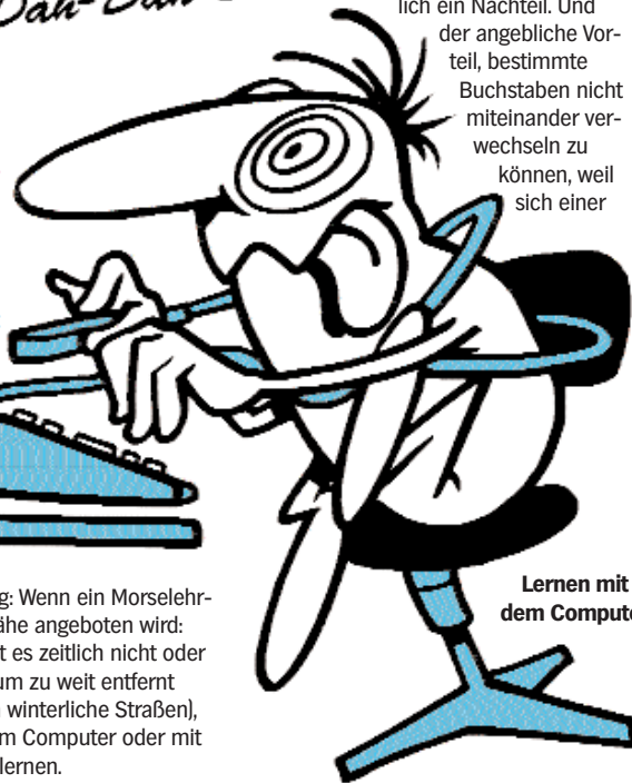
Lernen mit dem Computer

System bereits alle (!) Zeichen schon seit zwölf Abenden gemeinsam übst. Das ist sicherlich ein Nachteil. Und der angebliche Vorteil, bestimmte Buchstaben nicht miteinander verwechseln zu können, weil sich einer